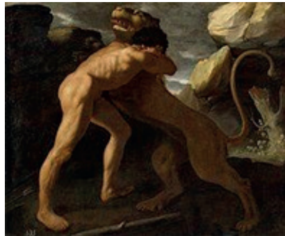
Francisco de Zurbarán, Hercule affrontant le lion de Némée , 1634.

Cerbère ne va pas laisser passer Héraclès car c'est un vivant et car il a tué son frère.