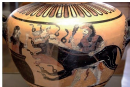
La capture de Cerbère par Héraclès, Herakles, Cerberus and Eurystheus, gravure de Hans Sebald Beham tirée Céramiques et terres cuites, musée du des Travaux d'Hercule, 1545. Louvres, Paris.