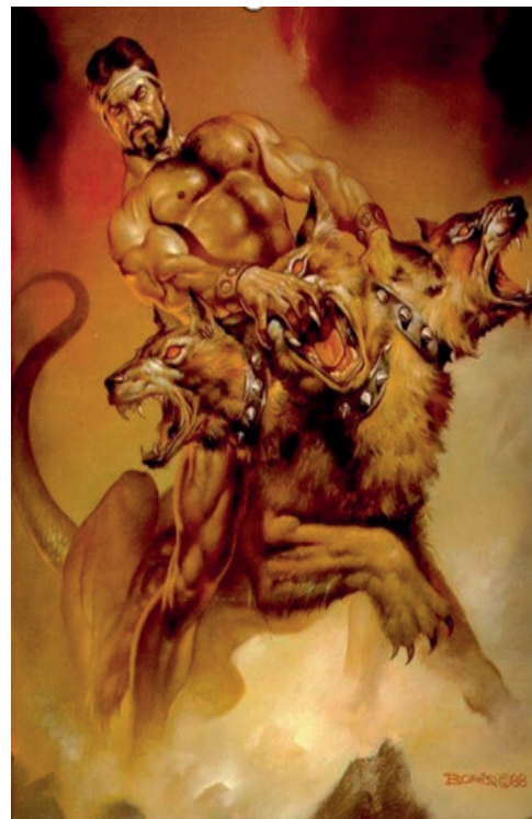
Héraclès enchaînant Cerbère par Boris Vallejo (1988)