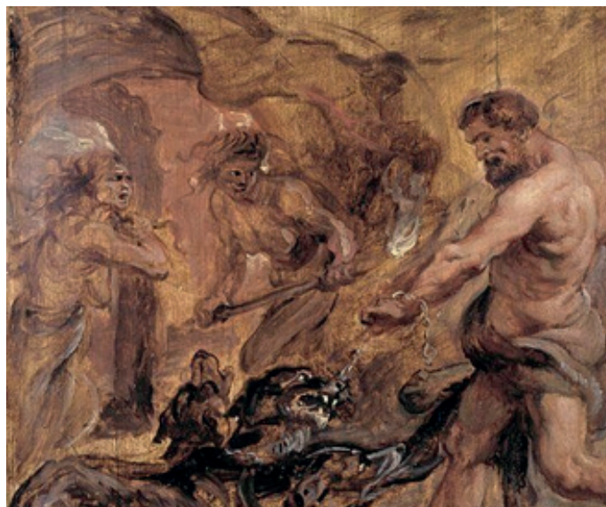
Paul Rubens, Hercules and Cerberus, huile sur panneau de bois, 1636.