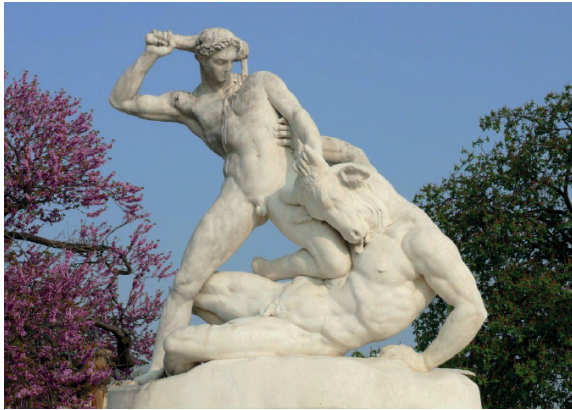
Thésée affrontant le Minotaure , d'après une sculpture de Jules Ramey, marbre, 1826, jardin des Tuileries, Paris.