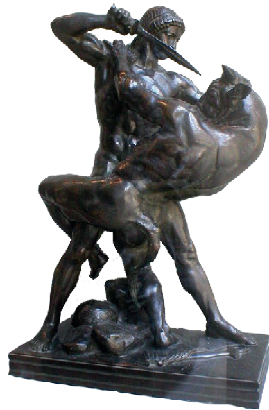
Antoine-Louis Barye, Thésée combattant le Minotaure , sculpture en bronze d'après le modèle en plâtre de 1843, musée du Louvre, Paris.