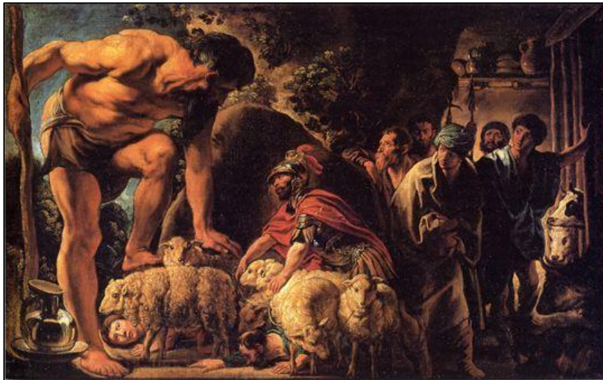
Jordaens, Jacob, Ulysse et Polyphème , peinture sur toile, entre 1630 et 1635, Moscou, Musée Pouchkine.