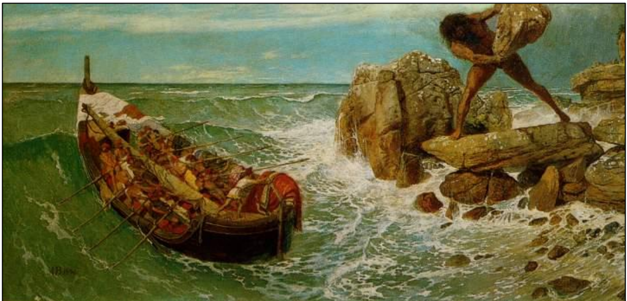
Arnold Böcklin, Ulysse et Polyphème , tempera sur bois, 1896.