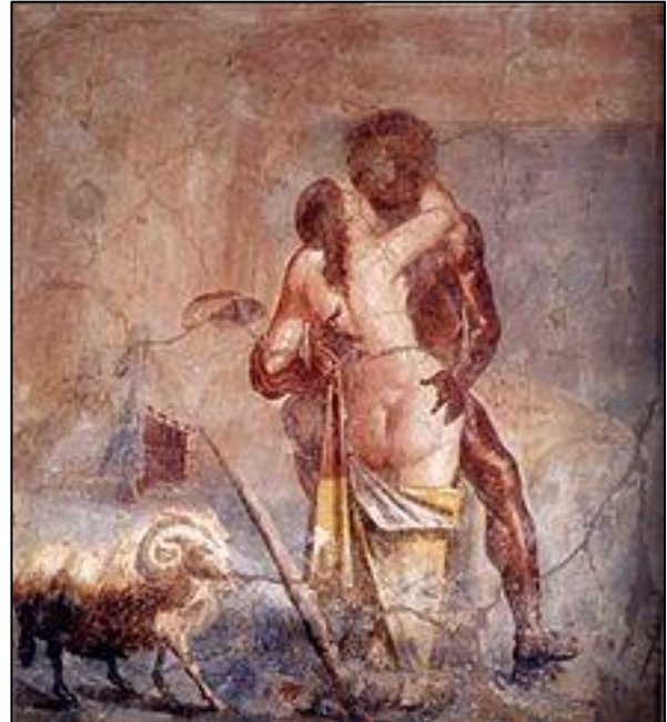
Doc 2 : Galatée et Polyphème, fresque romaine de la Maison de la Vieille Chasse à Pompéi, Musée archéologique national de Naples