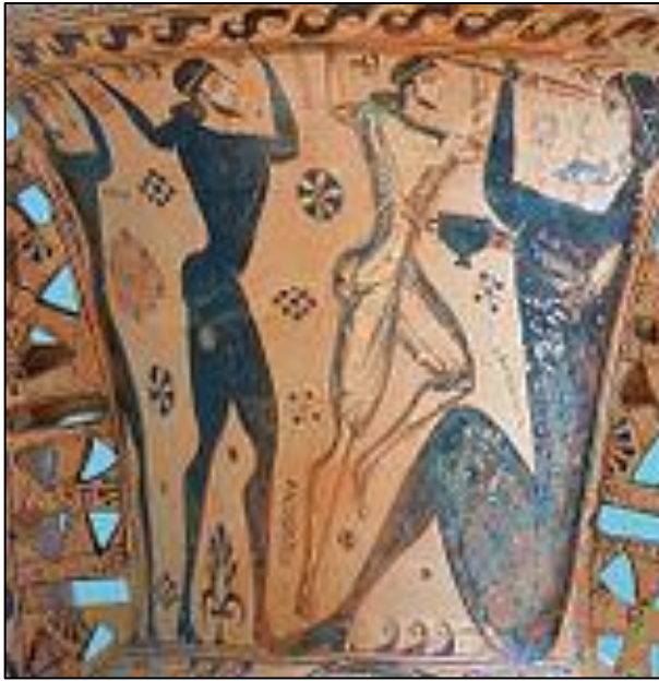
Doc 5 : Ulysse et son équipage aveuglent Polyphème . Détail d'une amphore proto-attique, vers 650 av.JC, musée d'Éleusis, Musée archéologique.