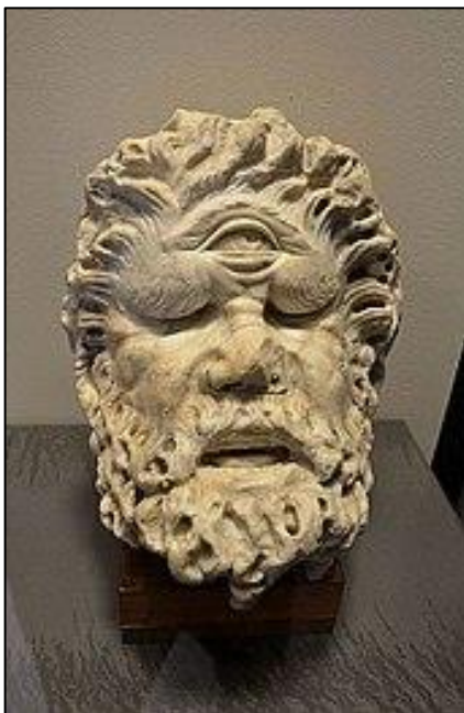
Doc 3 : Tête de cyclope . Sculpture attenante au Colisée de Rome, premier siècle après J.C.