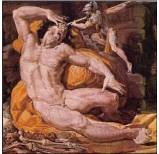
Doc 6 : Pellegrino Tibaldi, Ulysse et Polyphème , huile sur toile, 1554, palais de l'Université, Bologne.