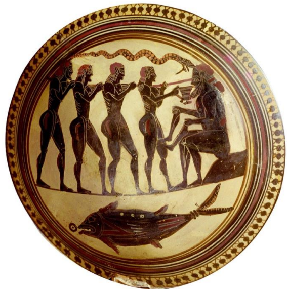
Doc 4 : Ulysse et ses compagnons aveuglant Polyphème, vers 565-560 av. J.-C., coupe laconienne à figures noires.