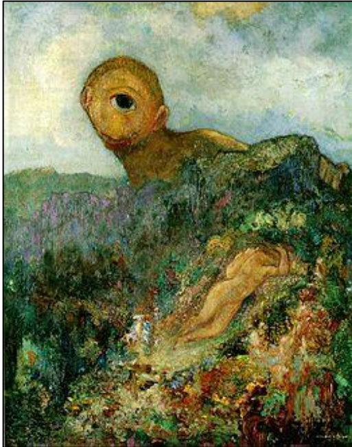
Doc 1 : Odilon Redon, Le Cyclope , vers 1914, huile sur carton, 64x52cm, Rijksmuseum Kröller-Müller, Otterlo.